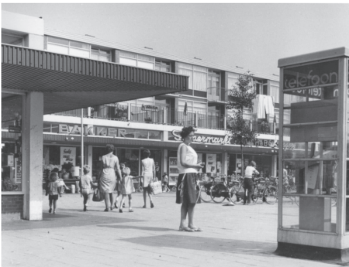
Dit is het buurtcentrum aan de Theemsdreef in juli 1967. Met telefooncel! Niet iedereen had thuis een telefoon. En mobieltjes hadden ze zelfs in sciencefictionfilms nog niet.