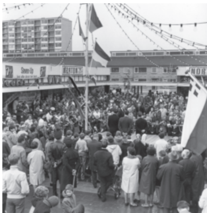
In oktober 1968 werd winkelcentrum de Berberhof officieel geopend. Toen mocht er nog reclame voor tabak gemaakt worden (zie de reclames van Norton Cigarettes). De Berberhof kreeg al vrij snel te maken met verpaupering. In 2002 is het gesloopt en in 2004 werd het nieuwe winkelcentrum De Gagelhof op deze plek geopend.