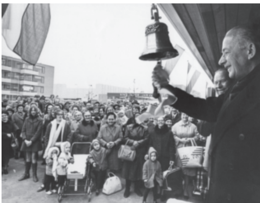
In november 1968 klonk de bel voor de officiële opening van winkelcentrum De Klop. Net als de Berberhof en Overkapel, waren de winkels rond een plein gebouwd. Achter de winkels zaten de magazijnen van waaruit de winkels bevoorrad werden. De winkels stonden als het ware met de rug naar de samenleving. Een opzet die De Berberhof en Overkapel niet hebben overleefd.